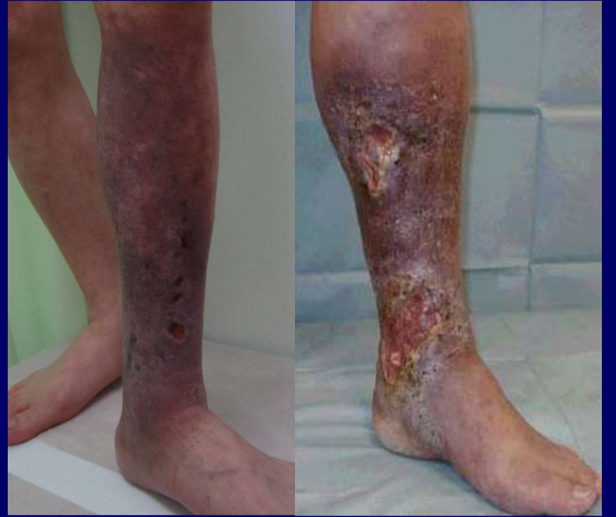
色素沈着、うっ滞性皮膚炎 うっ滞性潰瘍